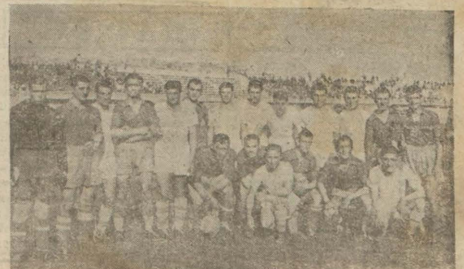
Evvelki gün karşılaşan Ankara Harbiye takımı ile Trabzon takımı oyuncularını bir arada (Yazısı 6 nci sayfada)

Beşiktaşlılar Trabzonu 4 - 0, Harbiye de İzmirin Göztepe takımını 5 - 1 yendiler