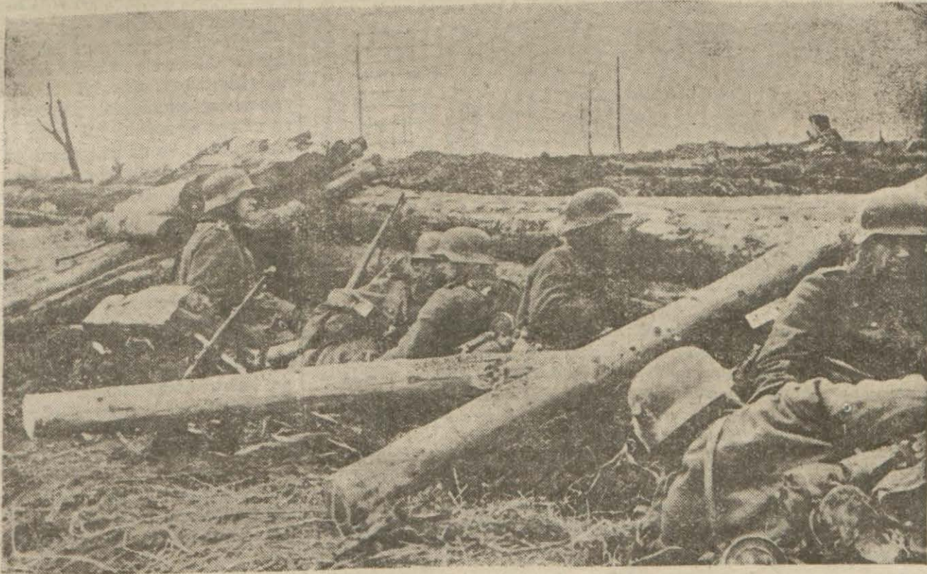
Doğu cephesinde: İleri hatlarda bir Alman piyade müfrezesi