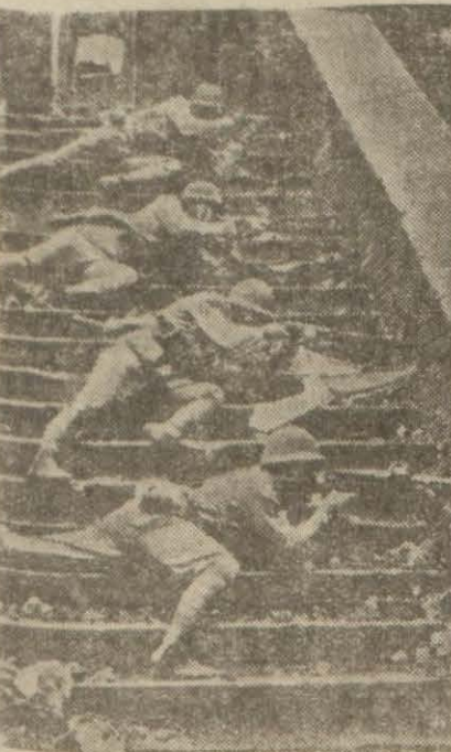
Bir Çin şehrinde çarpışan Japon askerleri

100 bin kişi kadar takviye alan Japonlar ileri hareketlerine devam... ediyorlar